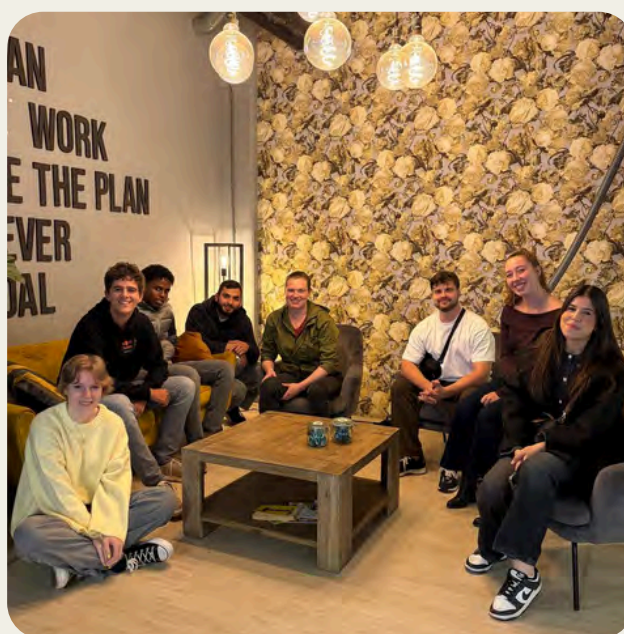
De eerste bijeenkomst van de Heldenraad.

In de praktijk zijn er vier Helden Meetups georganiseerd. De gemiddelde opkomst lag met zo'n zeven jongeren per bijeenkomst iets lager dan beoogd. Tegelijkertijd bleef het contact met de jongeren gedurende het jaar goed onderhouden. We zien wel dat nóg meer contact de community verder zou versterken en dit blijft daarom een belangrijk aandachtspunt. Een grote en langgekoesterde wens ging dit jaar in vervulling met de start van het jongerenpanel: De Heldenraad. Met acht enthousiaste en diverse deelnemers kwamen we twee keer samen. Tijdens deze bijeenkomsten dachten de jongeren mee over de invulling van de Helden Meetups en over manieren om nieuwe helden te werven.