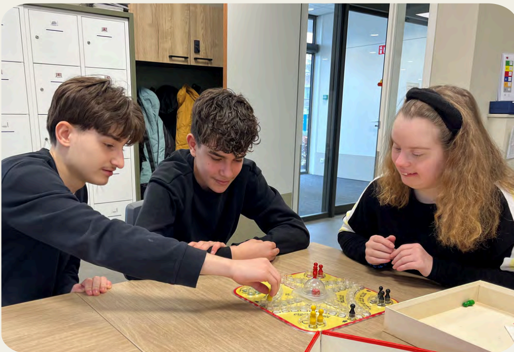
Leerlingen van Insula College doen spelletjes met bezoekers van het activiteitscentrum van Gemiva.

Dordtse Helden zet zich in om de leerlingen van het Insula College te verbinden aan maatschappelijke organisaties, waar zij ervaring op kunnen doen en hun talenten en vaardigheden kunnen inzetten in het kader van hun burgerschapsprogramma. We zetten onze expertise m.b.t. jongeren en vrijwilligerswerk daarbij in. Dordtse Helden inspireert en coacht de leerlingen in het uitvoeren van het praktijkgedeelte, o.a. door het aanbieden van maatschappelijke doeplekken en het ondersteunen bij projecten of actiedagen. De doelstelling van het project is om in drie jaar tijd 900 jongeren te laten deelnemen aan de MDT.