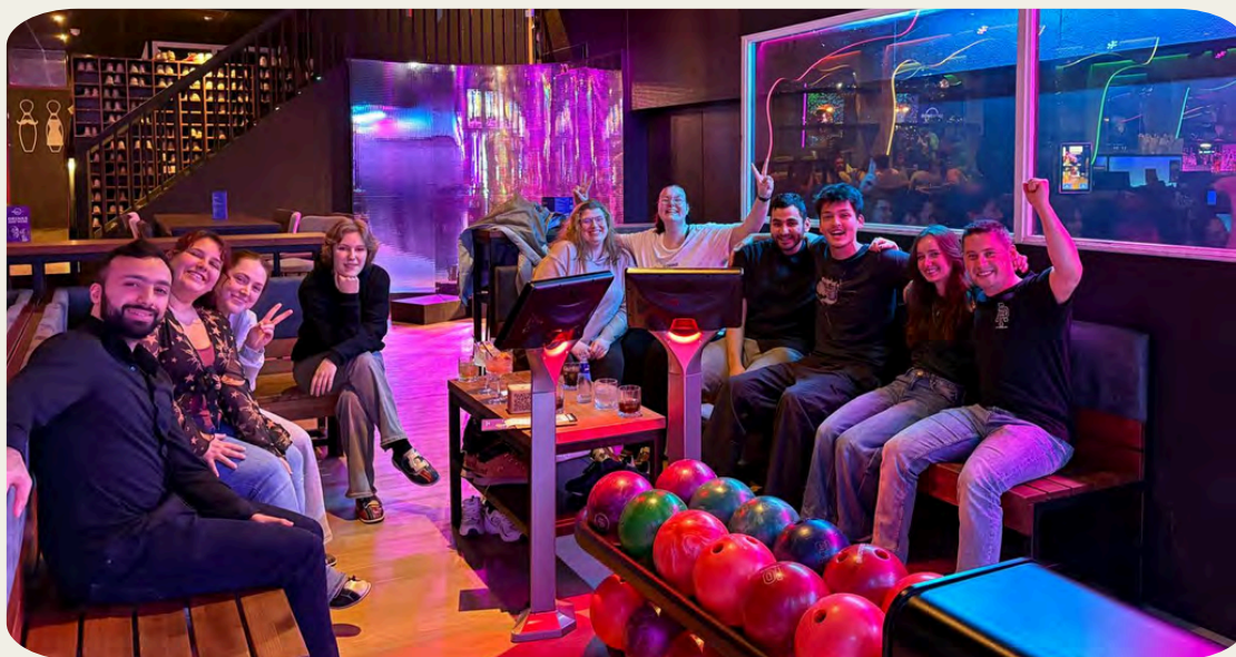
Jongeren ontmoeten elkaar tijdens de Helden Meetup. Een goed bezochte activiteit dankzij de input van de Heldenraad.

Tijdens een bijeenkomst van De Heldenraad spraken we met de jongeren over de Helden Meetups. Zij kwamen met verrassende en leuke ideeën om meer jongeren te trekken. Eén van de ideeën was het organiseren van een bowling night. Vanuit hun input organiseerden deze activiteit. Het resultaat? De bowling night werd direct goed bezocht. Een mooi voorbeeld van hoe inspraak werkt: wanneer jongeren meedenken, voelen zij zich eigenaar en groeit de betrokkenheid vanzelf.